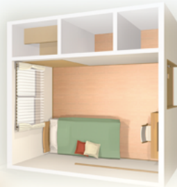
食堂・居間イメージ